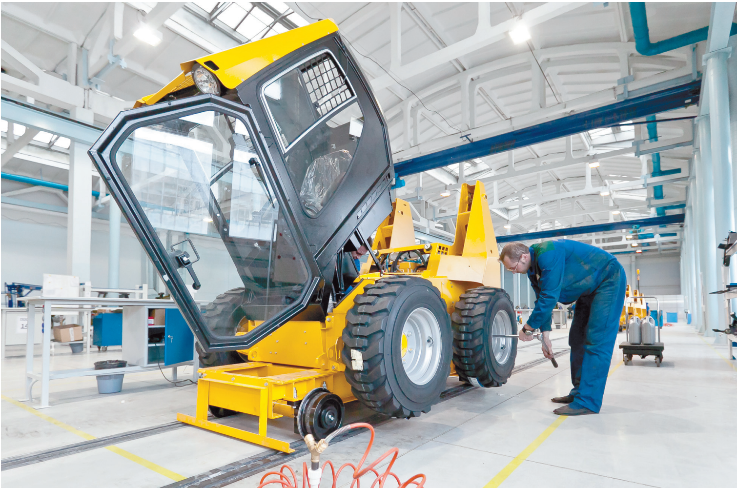
Двигатель развития нашей области - машиностроение и металлообработка.