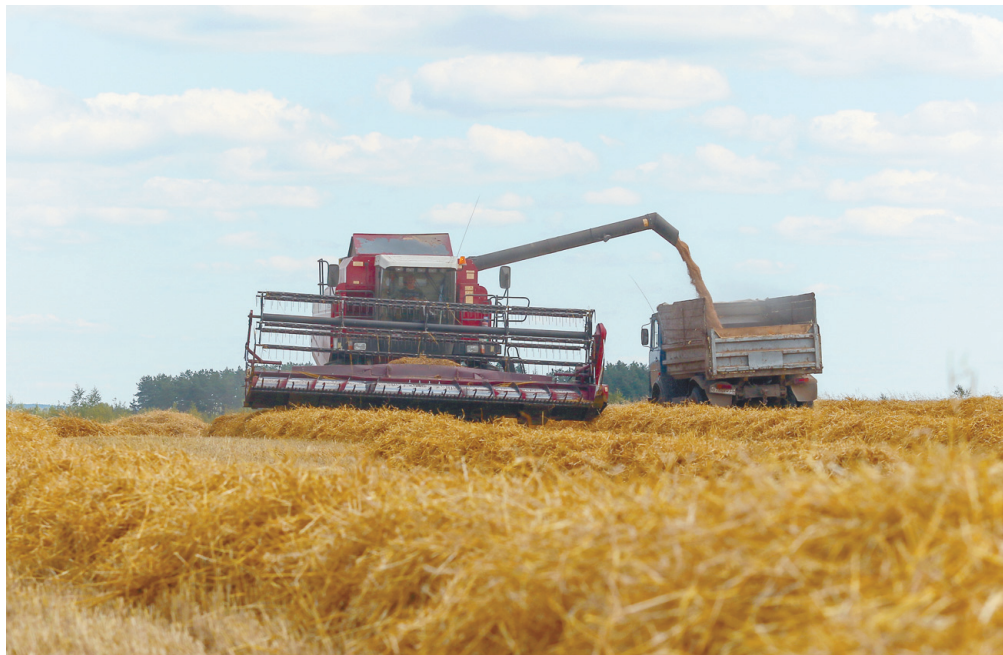
Отгрузка зерновых и зернобобовых культур в I полугодии 2017 года составила 90% к АППГ.

Иван СТЕПАНОВ. Инфографика Яна ЗАСЛАВСКОГО по материалам Владоблстата.