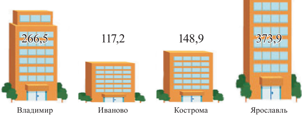
Таблица 2. Производство продукции в сельхозорганизациях