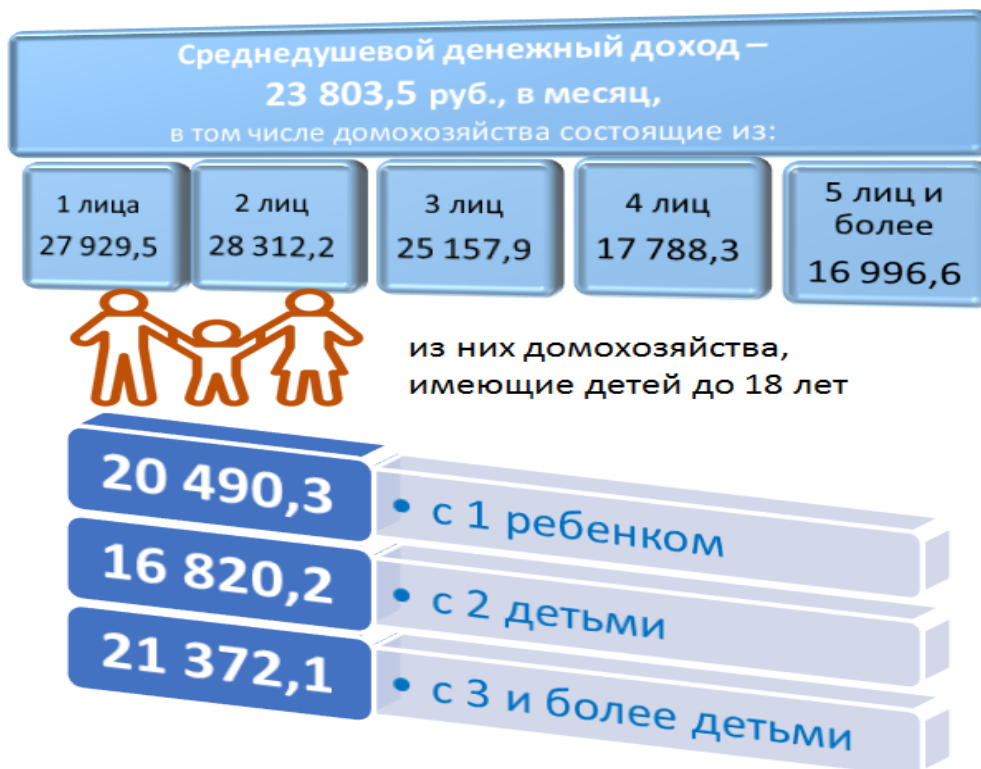
Рис. 1 Уровень денежных доходов домашних хозяйств Владимирской области в 2019 году (в среднем на члена домохозяйства, руб. в месяц)

Распределение денежных доходов населения в зависимости от состава домохозяйства можно представить следующим образом: