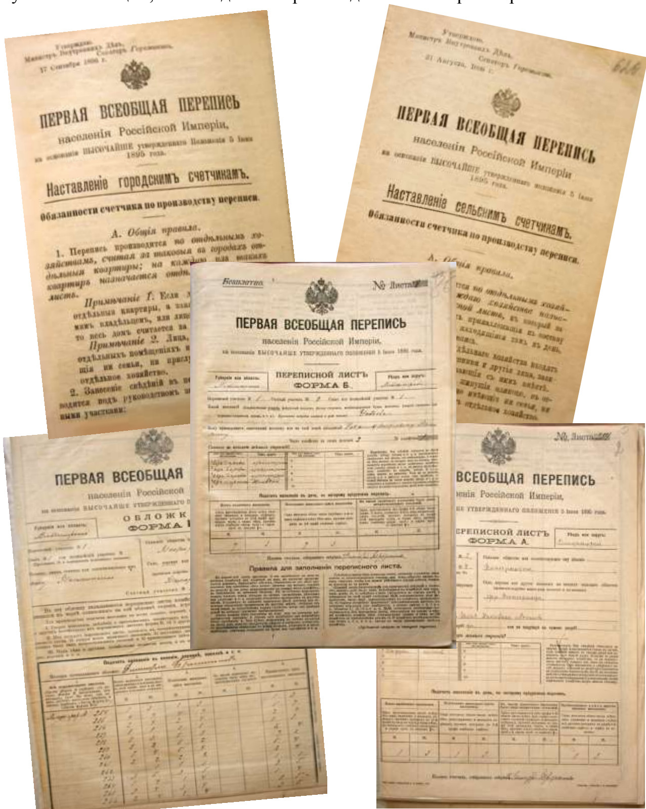
Фрагменты документов первой Всеобщей переписи населения Российской Империи 1897г.

Во Владимирстате сохранились уникальные архивные документы той первой переписи. Здесь и формы переписных листов, и наставления переписчикам - тогда их называли "счетчиками". Причем отдельно для городских, а отдельно для сельских счетчиков! Так же, как сейчас, переписчик должен было дойти до каждого дома, зафиксировать, сколько в нем живет мужчин и женщин, из чего дом построен и даже чем покрыта крыша.